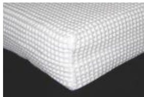
エアロメッシュ枕