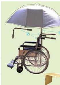
二人に優しい車椅子