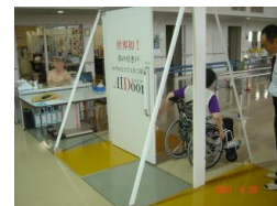
力を入れなくても動くドア エイドア ※受注後製造します