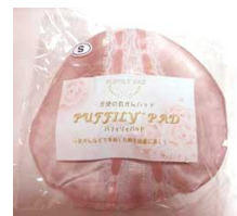
乳がんパッド パフィーパッド