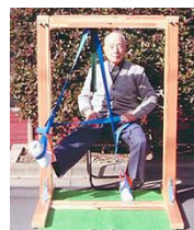
健康ブランコ ※受注後製造します