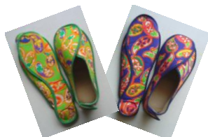
アットマイシューズ