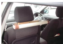
しっかり君 ※受注後製造します