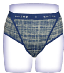
ゆには尿漏れパンツ