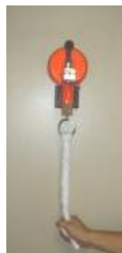
タオル絞り機 ※受注後製造します