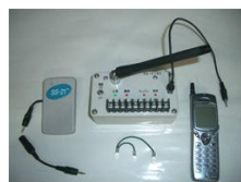
徘徊探知機Q助 ※受注後製造します