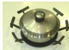
スーパー五徳 ※受注後製造します