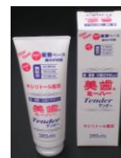
ミーハー 歯磨き剤