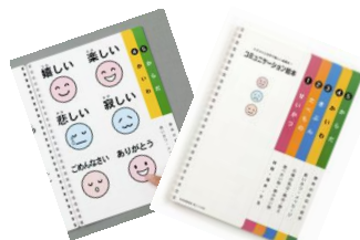
コミュニケーション絵本