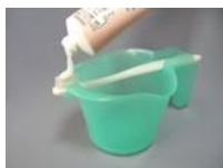
片麻痺歯磨き自助具 パラリンコップ