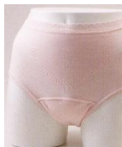
美百姫尿モレ ショーツ