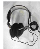
音声増幅器 FMオレイユ